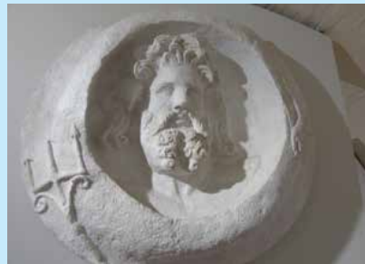
Arco di Augusto calco di un particolare

a causa delle piene devastanti che si sono succedute nei secoli. A questo punto sarà d'obbligo una sosta al Visitor Center della Rimini Romana in Corso d'Augusto, 235 ( www.riminiromana.it ) dove grazie ad installazioni multimediali e touch screen, non senza l'aiuto di Giulio Cesare, ci si potrà immergere in vari aspetti della Rimini Romana e non solo. Proseguendo per il Corso, l'antico decumano, sulla destra cento metri più avanti troveremo Piazza Cavour